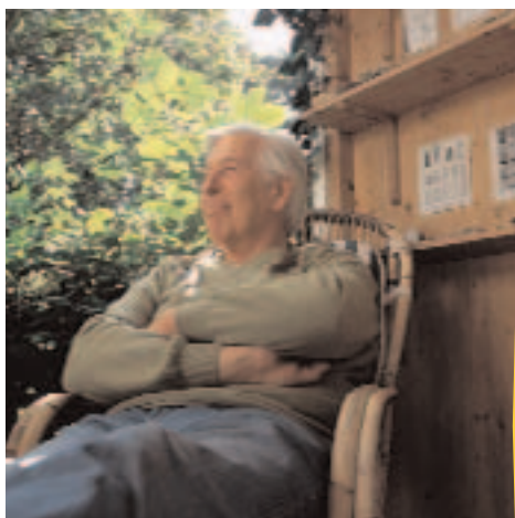
Se préparer une retraite sereine... c'est possible avec les solutions proposées par Aviva.

F. L. : L'exploitant choisit lui-même le montant de sa cotisation (75 € par mois minimum et 1 500 € maximum). Ensuite, il a la possibilité de moduler ces versements mensuels et d'effectuer des versements complémentaires. Au terme de son contrat, il récupère son épargne sous forme de rente viagère. Celle-ci peut être assortie de deux options : la réversion totale ou