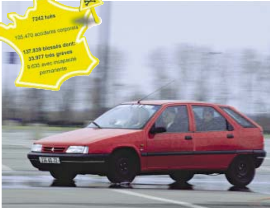
Appréciation des distances de freinage sur circuit.